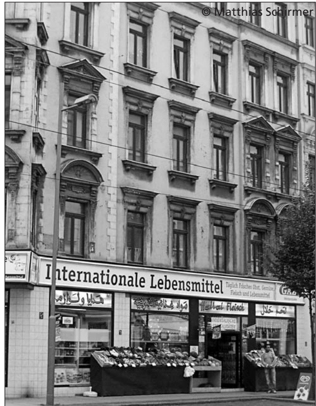
Wie soll sich der Hof entwickeln?

überlegt wird, was in der aktuellen Situation unter den spezifischen Voraussetzungen, mit den verfügbaren Akteuren und Ressourcen mit welchem Ziel und für welche Zielgruppe erreicht werden soll. Dazu müssen Methoden und Verfahren in der Arbeit immer wieder neu gefunden, entwickelt und abgewandelt werden. Starre Raster helfen hier nicht weiter.