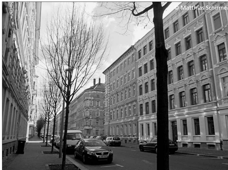
Die Menschen müssen an der Entwicklung ihres Stadtteils beteiligt werden

Maria Lüttringhaus konstatiert: „Partizipation befördert die Demokratie ... Gesellschaftlicher Gemein-sinn bzw. gesellschaftliche Verantwortung entsteht durch Partizipation.“ 4