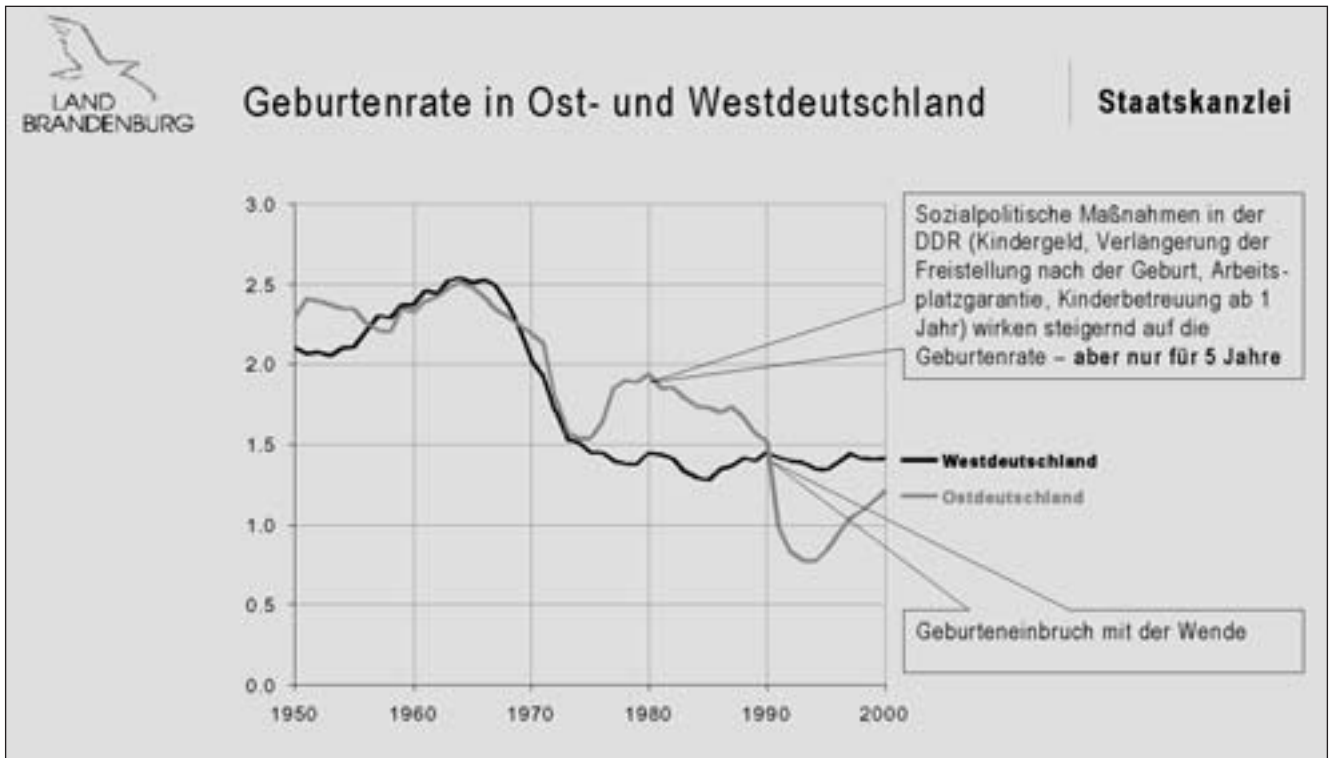
Abb. 1: Die Geburtenrate in Ost- und Westdeutschland 1959 – 2000 2

terung und Vergreisung der Gesellschaft. In Japan werden die Menschen noch älter als bei uns. Dort spricht man vom „Land des langen Lebens“.